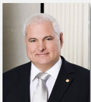
Ricardo Martinelli Presidente de Panamá