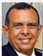
Porfirio Lobo Sosa Presidente de Honduras

"Estrategia para desarrollo sostenible de un país en el marco de una sólida integración latinoamericana"