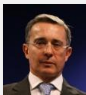
Álvaro Uribe Vélez Ex Presidente de Colombia