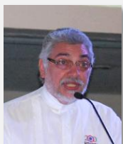
Fernando Amindo Lugo Méndez Presidente de Paraguay