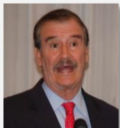
Vicente Fox Ex Presidente de México

"Manejo de las asimetrías locales de Infraestructura, transporte y distribución en la integración regional"